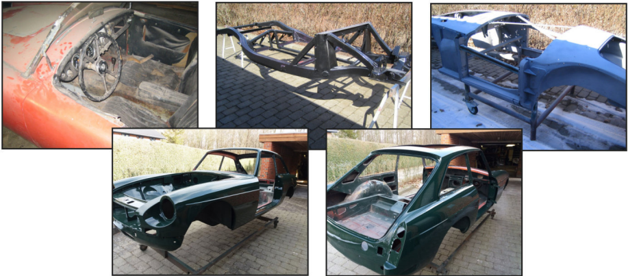
Før og undervejs billeder af de 2 MG'er

MGB GT 1800, årgang 1971 , købt i Danmark i 2016. Bilen var i mekanisk god stand og til en OK pris, men der viste sig at være en del rust, som blev udbedret under renoveringen. Bilen blev efterfølgende lakeret.