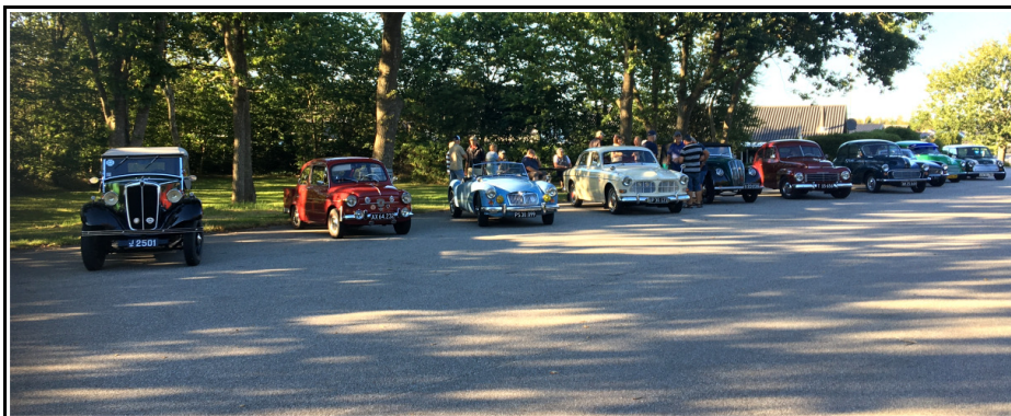
Line-up på rasteplass ved Birkelse, klar til en aftenkøretur.