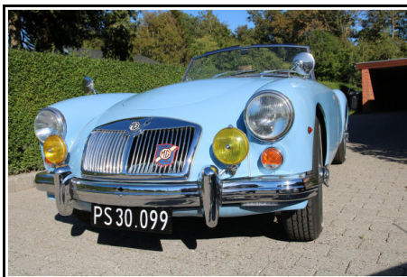
Billeder af de 2 MG'er som de står i dag