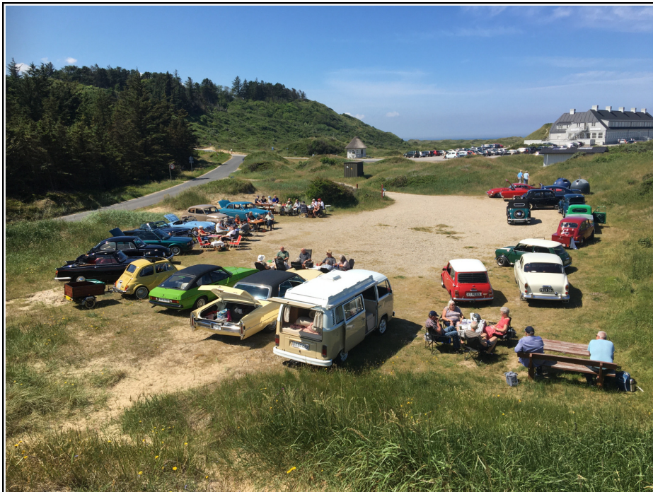
Sommertræf – indtagelse af frokost, med Svinkløv i baggrunden.