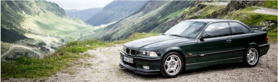
En BMW M3 fra 1995, er ikke veteran i år, men er det om få måneder

På hjemmesiden ligger også de komplette nyhedsbreve som er udsendt, samt masse af anden information.