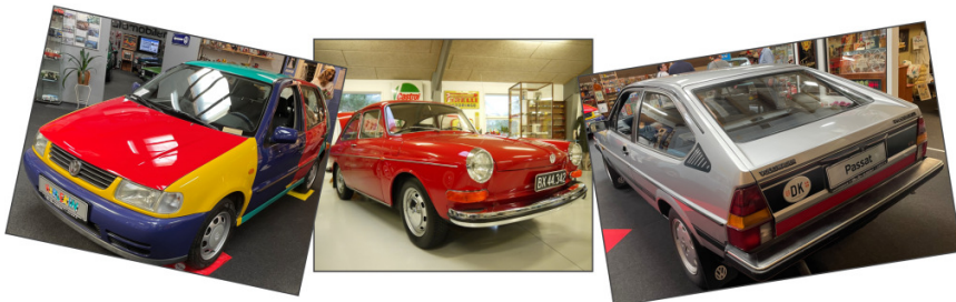
Legendariske Polo Harlekin, VW 1600 og 2. generation Passat