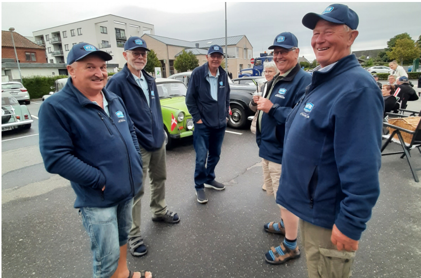
5 reglementeret påklædte herrer på tur...