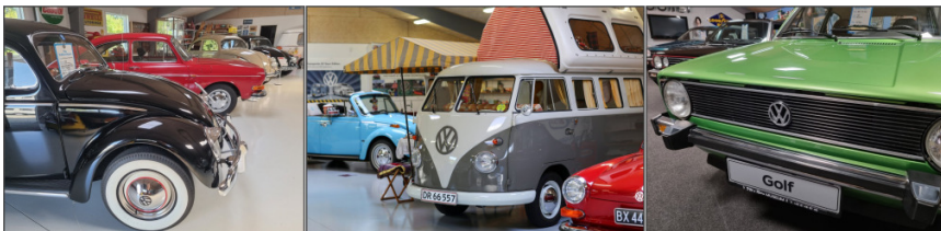
Gamle bobler, T1 bus og 3 første generationer af Golf

Jeg indrømmer gerne at jeg nok er en smule farvet. Men jeg synes nu alligevel at det er værdt at gøre honnør når VW Golf (der er solgt i over 37 millioner styk) i år fejrer 50 år. For at gøre det mere håndgribeligt, har jeg set det beskrevet således: Hver evige og eneste af ugens 7 dage, året rundt, i de sidste 50 år, har godt og vel 2.000 mennesker, verden over, besluttet sig for at købe en fabriksny VW Golf.