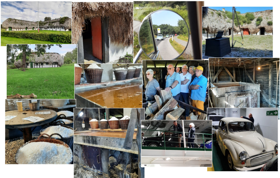
Stemningsbilleder fra læsø-turen

Tak til alle for hyggeligt samvær. Og en særlig tak til dem som fik turen stablet på benene.