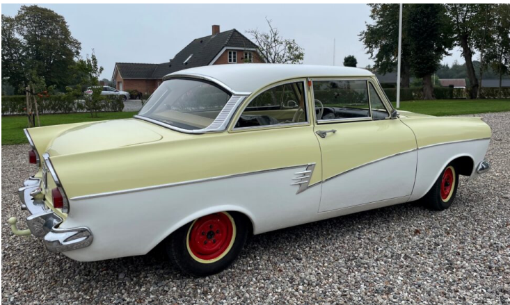
Denne Ford Taunus P2, fra 1960, var uforvarende med i et uheld der betyder at den næppe kommer på vejen igen. Ejeren fik dog lov at købe bilen tilbage efter totalskaden. Læs på MhS's hjemmeside, hvordan man gør det.

Om man har kaskodækning eller kun ansvarsdækning, har ingen indflydelse på, hvor resterne / skadet køretøj havner til sidst.