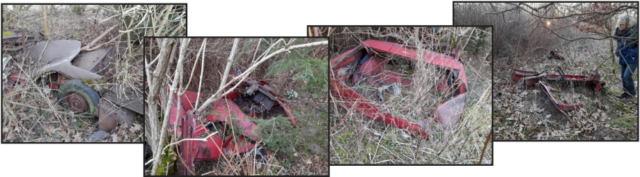
Jørn Ditlev (1001)

Det er dejligt at der også findes steder hvor tiden har fået lov til at stå stille.