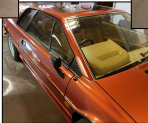
Lotus Esprite og en overdækket Cadillac de Ville i garagen