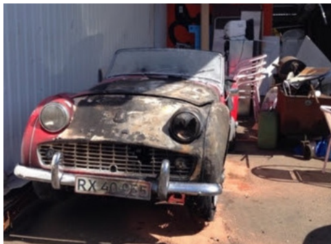
Denne TR3 er et eksempel på hvordan reglerne var tidligere ved totalskade

Derfor er det en rigtig god ide at få en grundig snak med taksatoren og måske også med Motorstyrelsen om, hvad du ønsker der skal ske med dit køretøj, hvis det bliver totalskadet.