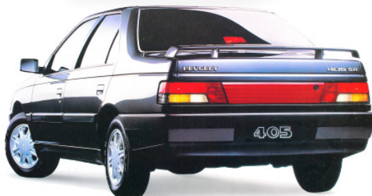
Opel Kadett E og Peugeot 405, begge på Top-10 i 1988