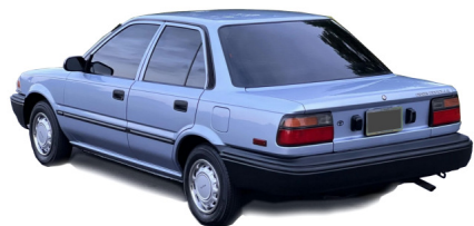
Toyota Corolla 1988

At vi danskere i dag er blevet bedre stillet rent privatøkonomisk (selv om vi nordjyder måske vægrer os ved at indrømme det), kan man få en fornemmelse af, ved at kigge på hvilke biler der i 2022 udgjorde toppen af nybilsalget. På listen finder vi mærker