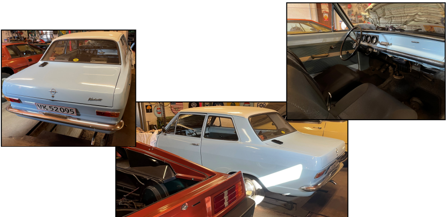
Et par billeder af Kadett'en, der ikke er helt færdigsamlet endnu